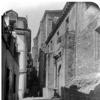
San Telmo museoa

Esta callejuela sin portales es el único ejemplo que nos queda de la ciudad antigua. En la Edad Media, dentro de la ciudad amurallada, las calles eran estrechas y oscuras